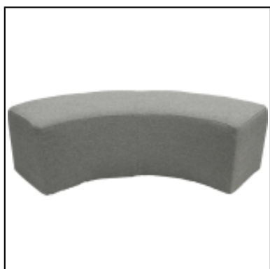
Pouf Tweed 1/4 rond L230 - gris