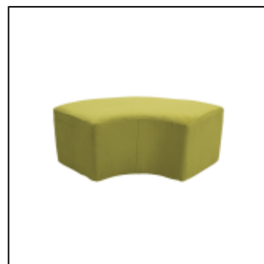
Pouf Tweed 1/4 rond L150 - anis