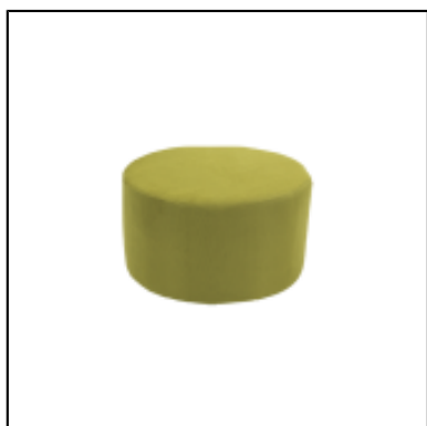
Pouf Tweed rond dia70 - anis