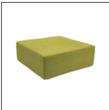
Pouf Tweed carré L100 - anis