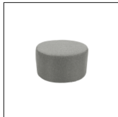
Pouf Tweed rond dia70 - gris