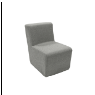
Chauffeuse Tweed Square L50 - gris