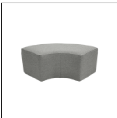
Pouf Tweed 1/4 rond L150 - gris