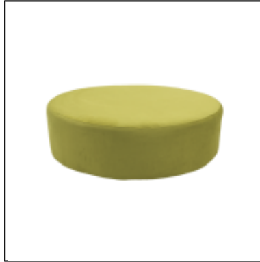
Pouf Tweed rond dia120 - anis