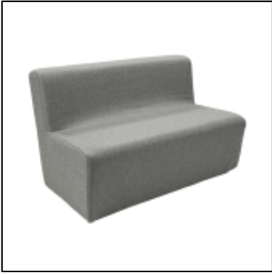
Chauffeuse Tweed Square L120 - gris