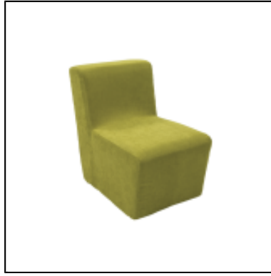
Chauffeuse Tweed Square L50 - anis