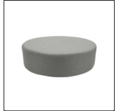
Pouf Tweed rond dia120 - gris