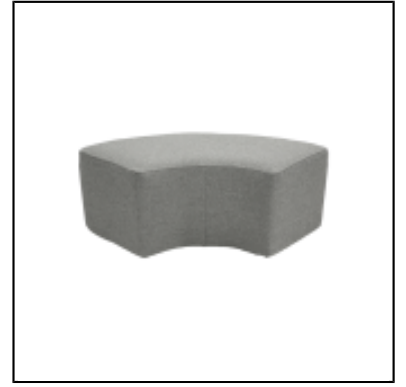
Pouf Tweed 1/4 rond L150 - gris