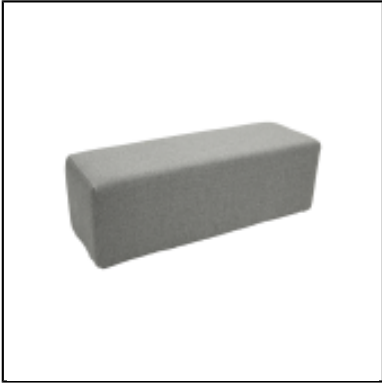
Pouf Tweed 120x40 - gris