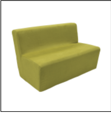
Chauffeuse Tweed Square L120 - anis