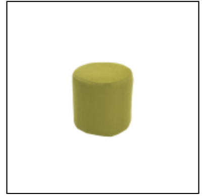
Pouf rond Tweed - anis