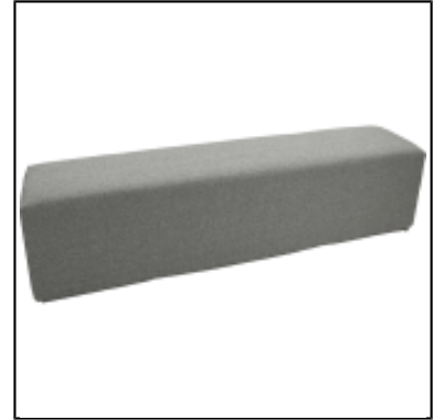
Pouf Tweed 200x40 - gris