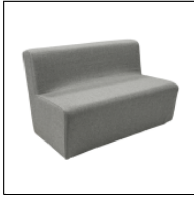
Chauffeuse Tweed Square L120 - gris