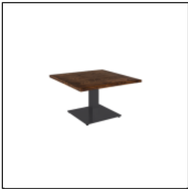
Table Stan H35 70x70 - bois & noir