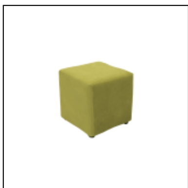
Pouf carré Tweed - anis