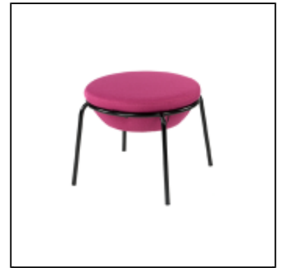
Pouf Kapsule XL - fuchsia