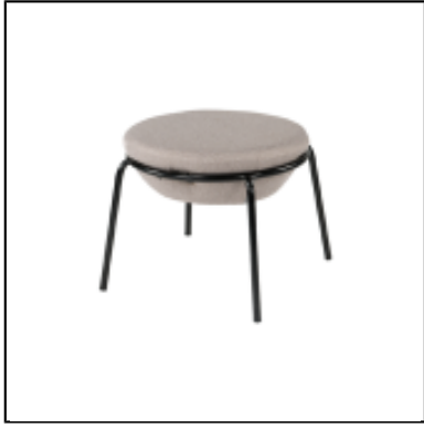
Pouf Kapsule XL - gris