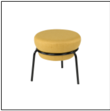
Pouf Kapsule S - moutarde