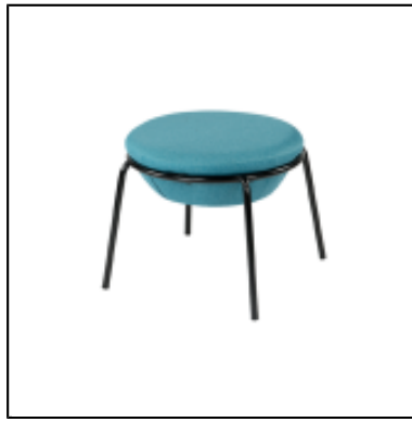
Pouf Kapsule XL - bleu