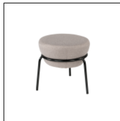
Pouf Kapsule S - gris