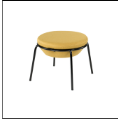
Pouf Kapsule XL - moutarde