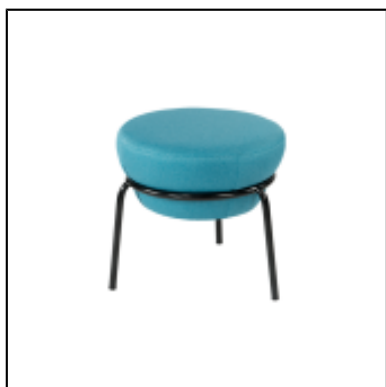
Pouf Kapsule S - bleu