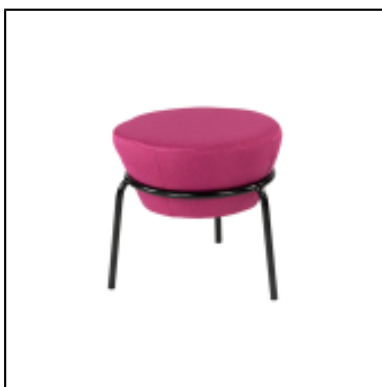
Pouf Kapsule S - fuchsia