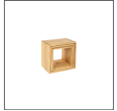
Open cube wood