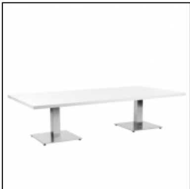
Tables basses STAN rectangulaire