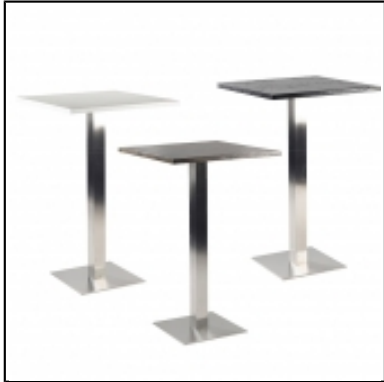
Mange-debout Stan carré