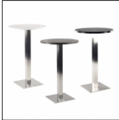
Mange-debout Stan rond