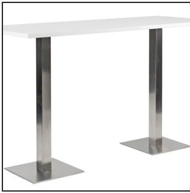
mange-debout stan 70x180 blanc