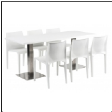
Tables STAN rectangulaire