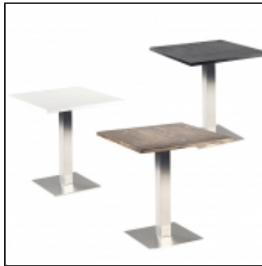
Tables STAN carrée