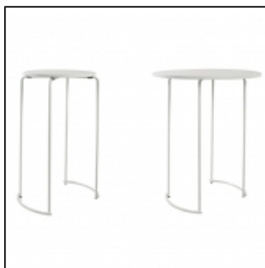
Tables hautes Tiketac