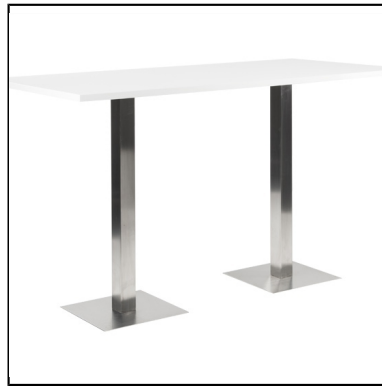
mange-debout stan 90x180 blanc