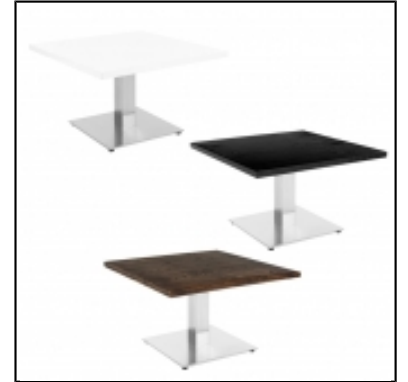
Tables basses STAN carrée