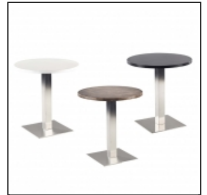
Tables STAN ronde