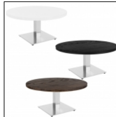
Tables basses STAN ronde