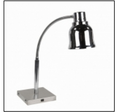
Lampe chauffante sur pied