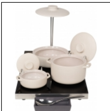
Cooking Cocottes KOTKOT