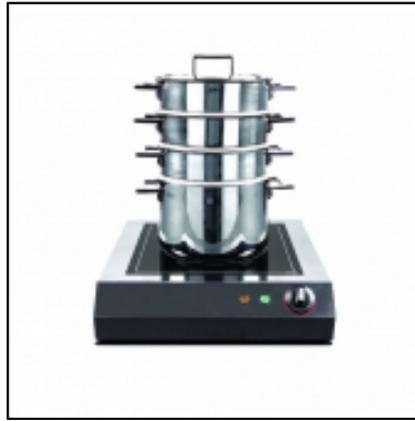
Cooking Steamer Attika