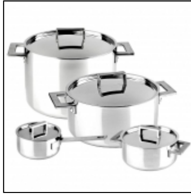
Cocottes et Marmites Attika