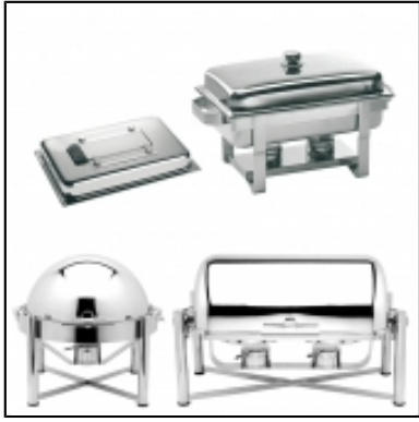
Chafing dish et réchaud argent