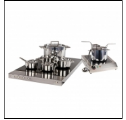
Cooking Pasta Attika