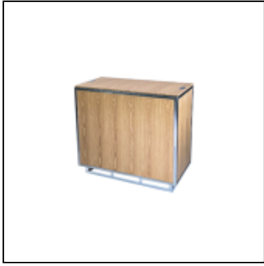
Console UP H90 100x50 - bois