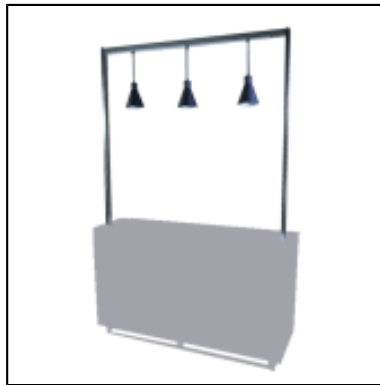
Mâts et lampes triangulaires UP - L150 cm