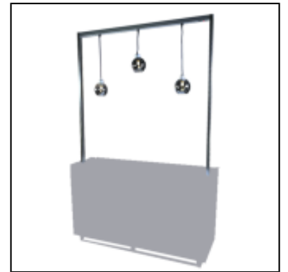
Mâts et lampes globes UP - L150 cm