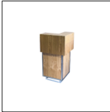
Comptoir d'angle UP H110 50x50 - bois