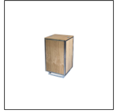
Console UP H90 50x50 - bois