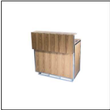
Comptoir UP H110 100x50 - bois