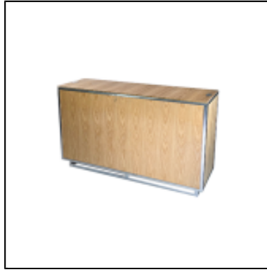
Console UP H90 150x50 - bois