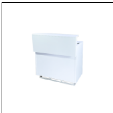
Comptoir UP H110 100x50 - blanc