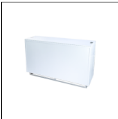
Console UP H90 150x50 - blanc