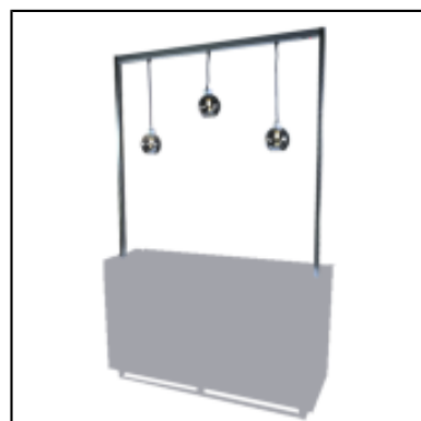
Mâts et lampes globes UP - L150 cm