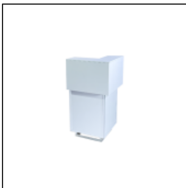
Comptoir d'angle UP H110 50x50 - blanc