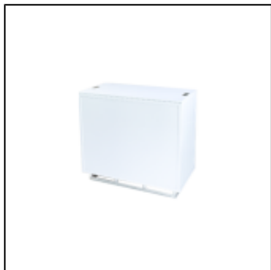
Console UP H90 100x50 - blanc