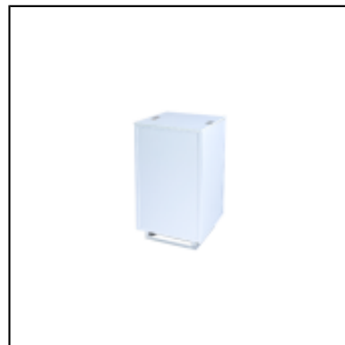
Console UP H90 50x50 - blanc