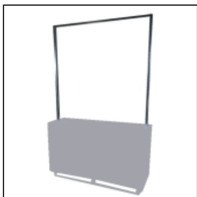
Mâts et barre enseigne UP - L150 cm