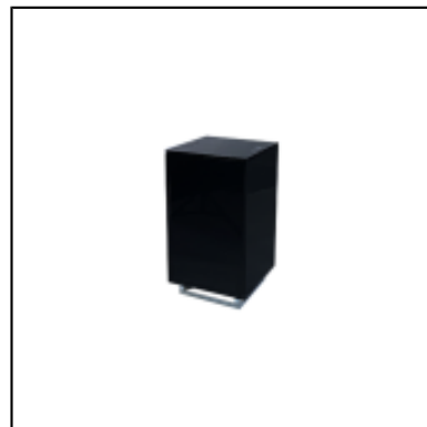
Console UP H90 50x50 - noir