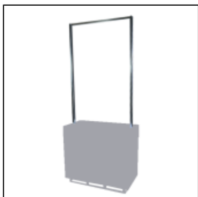
Mâts et barre enseigne UP - L100 cm