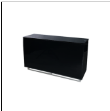
Console UP H90 150x50 - noir