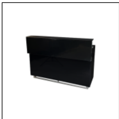
Comptoir UP H110 150x50 - noir