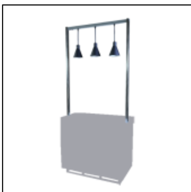
Mâts et lampes triangulaires UP - L100 cm