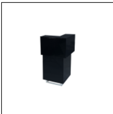
Comptoir d'angle UP H110 50x50 - noir