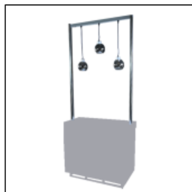
Mâts et lampes globes UP - L100 cm