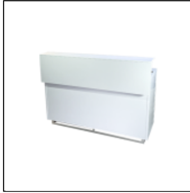
Comptoir UP H110 150x50 - blanc