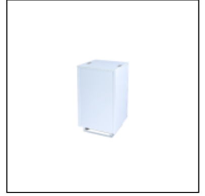
Console UP H90 50x50 - blanc