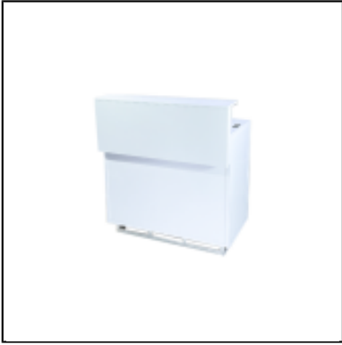
Comptoir UP H110 100x50 - blanc