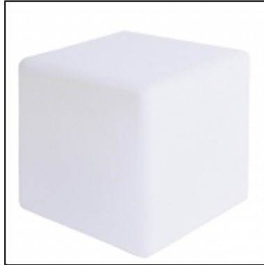
Guéridon cube lumineux