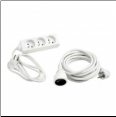
Rallonge - Triprise