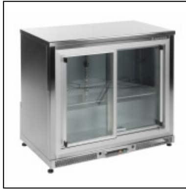
Arrière de bar - réfrigérateur 200 L