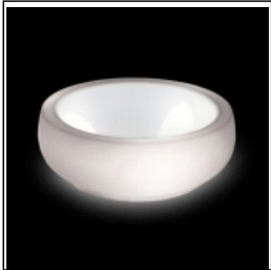
Table basse lumineuse Chubby