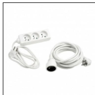
Rallonge - Triprise