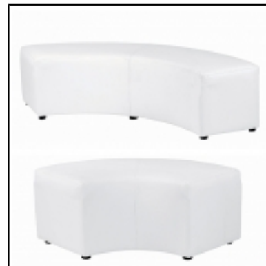
Poufs Nikki quart de rond