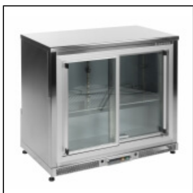
Arrière de bar - réfrigérateur 200 L