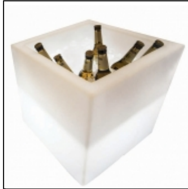
Open Cube lumineux