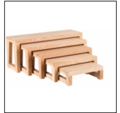
Réhaussees gigognes Sherwood