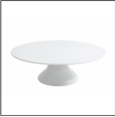
Plat à gâteau