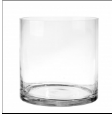
Vases en verre - modèle rond