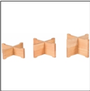
Réhaussees Sherwood X