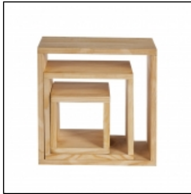
Réhaussees cube Sherwood