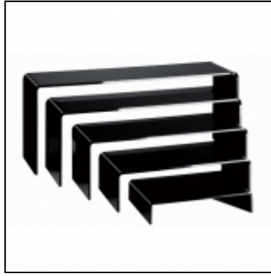
Réhaussees Gigognes Plexi