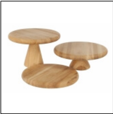
Cake stand Sherwood